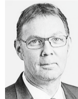
Peter V. Kunz Direktor des Instituts für Wirtschaftsrecht der Universität Bern

Obwohl ich selber kein Tieraktivist bin (und wohl nie sein werde), befürworte ich durchaus Aktivismus für Tiere, wenn auch nur im Rahmen der Legalität. Illegale Aktionen von radikalen Tieraktivisten hingegen bringen den Tieren überhaupt nichts, ganz im Gegenteil. Delikte führen zu gesellschaftlichen Polarisierungen, die sich nicht positiv zu Gunsten der Tiere auswirken. Tierrecht wird sich nicht durch Revolution, sondern ausschliesslich durch Evolution entwickeln. Radikale und illegale Aktionen liegen nicht im Tierinteresse, sondern sind peinliche Selbstinszenierungen sowie ideologische Egotrips – zu Lasten der Tiere.