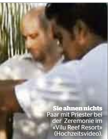
Sie ahnen nichts Paar mit Priester bei der Zeremonie im «Vilu Reef Resort» (Hochzeitsvideo).