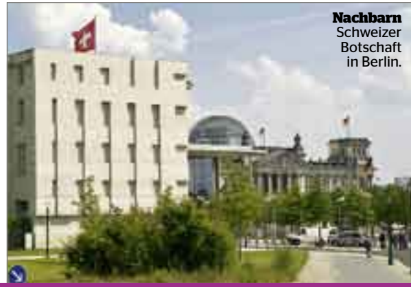
Nachbarn Schweizer Botschaft in Berlin.

Merz habe zwar einen «Triumph» für die Schweiz eingefahren, findet die «Süddeutsche Zeitung», ist aber auch der Meinung: Vom noch auszuhandelnden Abkommen profitieren beide Länder.