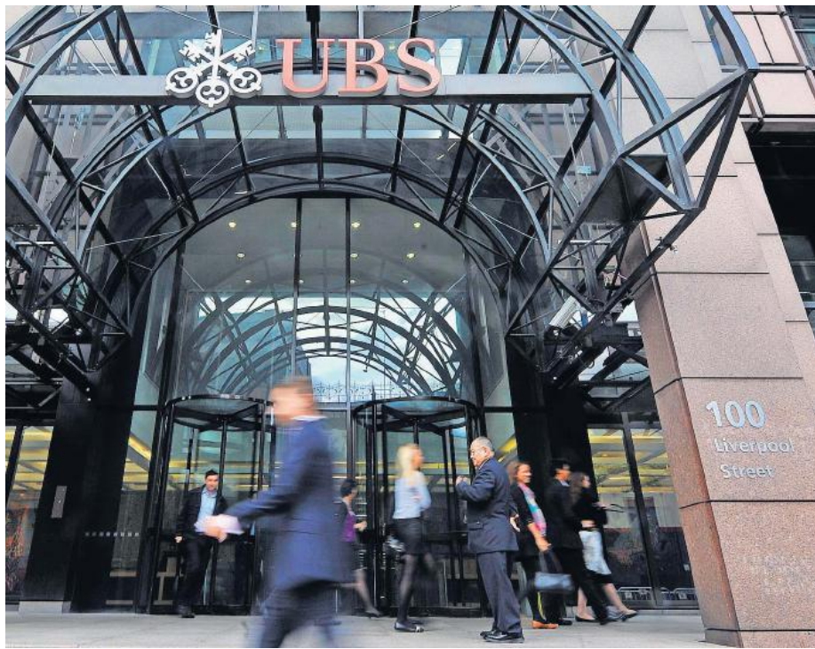
UBS-Filiale in London: In der britischen Hauptstadt sollen FBI-Agenten Zeugen befragt haben.

Die UBS wollte die neuen Vorwürfe gestern nicht kommentieren, wie ein Spre-