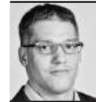
von Fabian Hägler

Vor sechs Jahren sagten die Einwohner von Wohlen an der Urne deutlich Nein: 58 Prozent der Stimmenden waren damals dagegen, die viertgrösste Gemeinde des Kantons zur Stadt zu erklären. Dass die Grossgemeinde, die heute gut 15 600 Einwohner zählt, sich weiter als Dorf bezeichnet, hat der Attraktivität der Agglomeration Wohlen keinen Abbruch getan. Laut der neuen Städtestatistik ist sie unter allen Agglomerations-