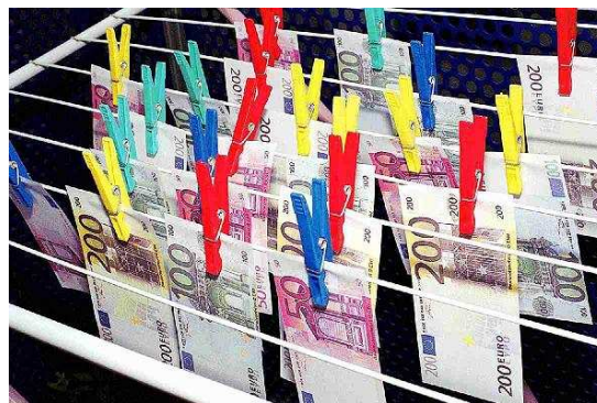
z.B. Geld- wäscherei (GwG)