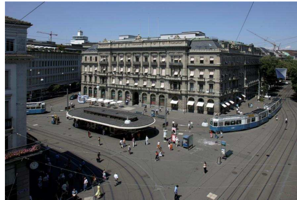
z.B. Banken (BankG)