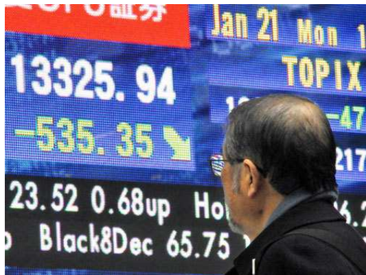
z.B. Börse- und Effektenhandel (BEHG)