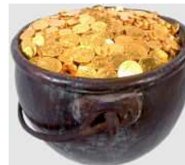
z.B. kollektive Kapitalanlage (KAG)